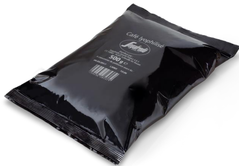
SACHET DE 500 G