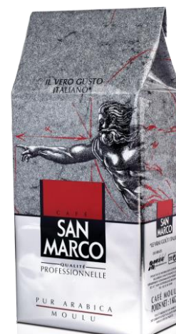
SAN MARCO KILO

Pur Arabica Goût racé, subtil et voluptueux > Existe en kilos Grain & Moulu Extra fin