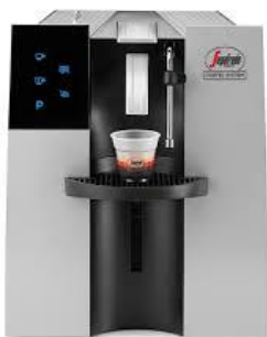
Machine New SZ