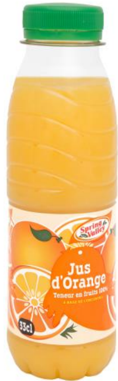
100% Jus d'Orange 3 516 130 002 252