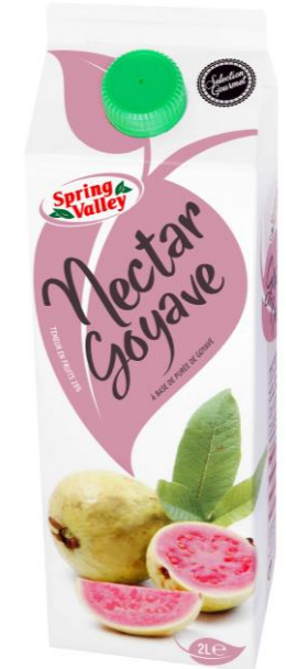
Nectar Goyave 3 516 130 002 045

1 palette: 80 colis de 6 briques => 480 briques (1.076Kg)