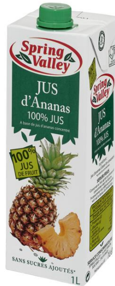
100% Jus d' Ananas 3 516 130 001 185