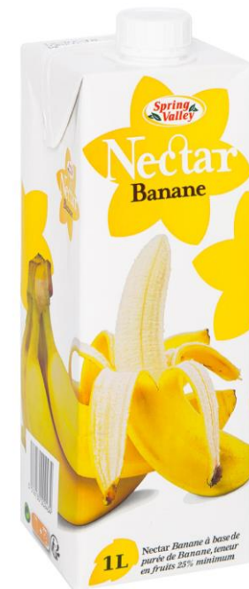
Nectar Banane 3 516 130 002 434

1 palette: 100 colis de 8 briques => 800 briques (900Kg)