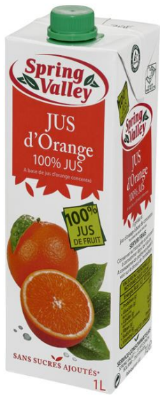
100% Jus d' Orange 3 516 130 000 041