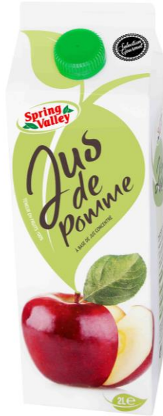
Jus de pomme 3 516 130 000 038