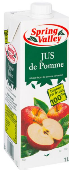
100% Jus de Pomme 3 516 130 000 058