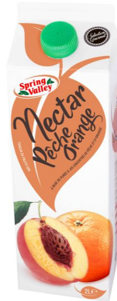
Nectar Pêche orange 3 516 130 000 348