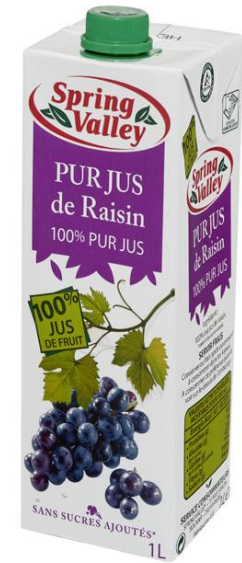
Pur jus de Raisin 3 516 130 000 508

1 palette: 100 colis de 8 briques => 800 briques (837Kg)