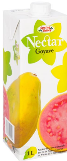
Nectar Goyave 3 516 130 001 208