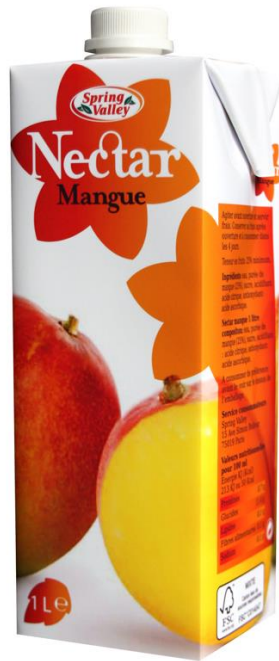
Nectar Manguue 3 516 130 001 161