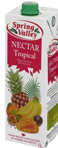
Nectar Tropical 3 516 130 001 246