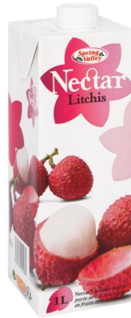
Nectar Litchees 3 516 130 001 284