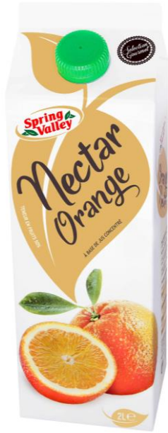
Nectar orange 3 516 130 000 331