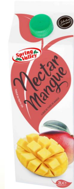
Nectar Mangue 3 516 130 001 741