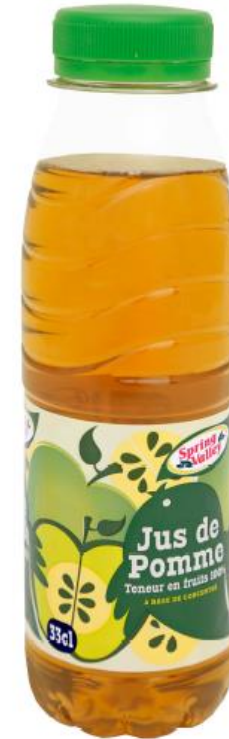
100% Jus de pomme 3 516 130 000 218

1 palette: 308 packs de 6 bouteilles => 1848 bouteilles (790Kg)