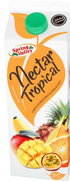
Nectar Tropical 3 516 130 000 065